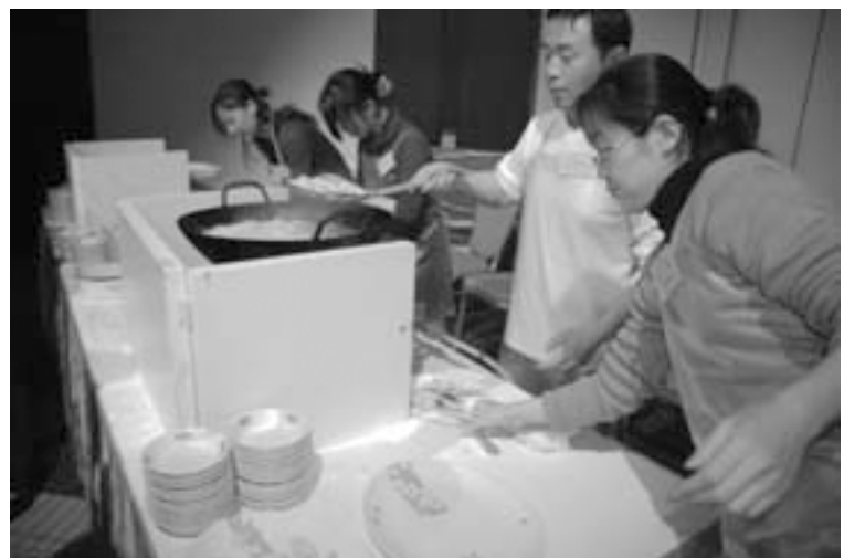
恒例の手作り餃子実演コーナー。今回は2500百個の手作り餃子を用意して、参加者に振舞った。