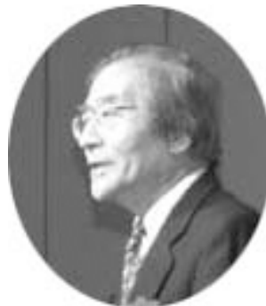
協力団体代表挨拶