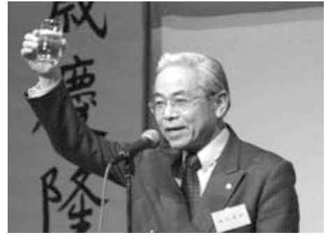
崎元達郎熊本大学学長の乾杯の音頭で祝宴が始まった。