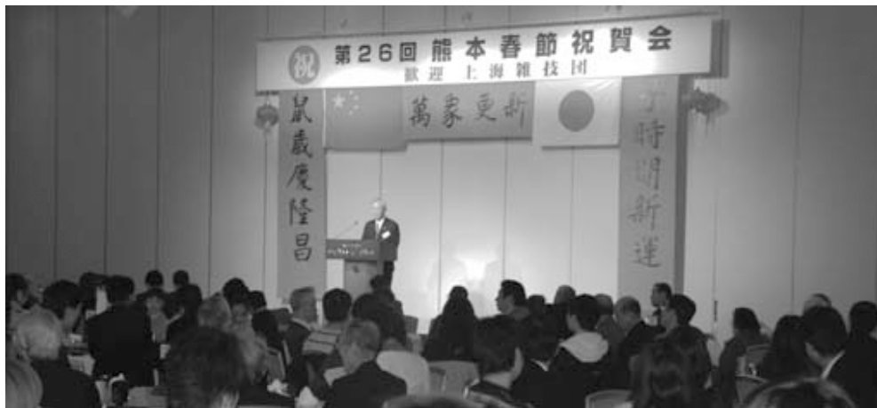
春聯(しゅんれん)の飾り付けが行われた前面のステージ

平成20年2月6日、第26回熊本春節祝賀会が熊本ホテルキャッスルで開催された。春節祝賀会は在熊の中国人留学生・研修生を招待して中国の様式で春節(旧正月)を祝うもので、熊本県日中協会では毎年開催している。