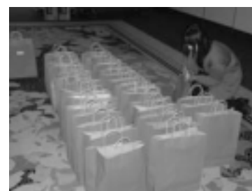
留学生全員へお土産