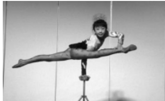
上海雑技団の素晴らしい演技