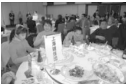
雑技団員も餃子を楽しんだ。