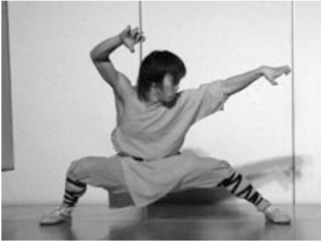
当協会会員の日本高山少林拳 連盟の皆さんによる演舞