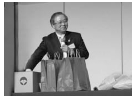
空クジなしの抽選会。 参加した留学生・研修生 全員にお土産が渡された