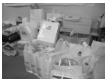
事務局に寄せられたた品物

10数名の留学生や中国帰国者の皆さんに協力してもらい、三日がかりで2500個の餃子作り。