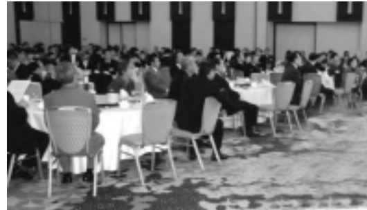
大勢の参加者でにぎわった。

春聯とは、中国の習慣で、新春を祝い、瑞気を迎えるために、赤い紙にめでたい文句を書いて、門柱や部屋の入り口の左右に、対にして張るものです。今年の春聯は、「ねの刻になると、好運にめぐりあい、ねの年に入ると、繁栄隆昌を祝う」と、開運の年であることを詠んでいます。