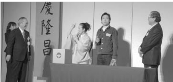
一等賞が当たって喜びの挨拶をする留学生