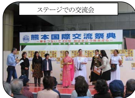
ステージでの交流会

今年で十五回目の「熊本国際交流祭典」が十月二十六日（日）、熊本交通センターコートで開催され、多くの県民で賑わいました（熊本県国際協会主催）。国際交流・協力を行っている県内の民間団体などの活動を県民に知ってもらうのが狙いで、三十四団体が参加、各催しを繰り広げました。熊本県日中協会も昨年からの参加、今年はグルメ部門に「中国茶芸の実演・体験コーナー」を設け、入れ立てのジャスミン茶を販売、人気を集めました。