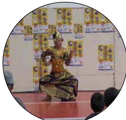
インドネシアの民族舞踊を披露