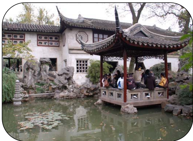
蘇州の留園は北京の頤和園、承德の避暑山荘、蘇州の拙政園とともに中国四大庭園の一つで、1997年に世界遺産に登録されました。

文化経済交流は取りも直さず、人と人との触れ合いと理解します。日中の人々が賑やかに集まる機会とその場を提供してまいります。その結果、少しでも中国の文化に対する理解が深まればと願っております。 平成二十一年が日中にとりましてより豊かな年でありましよう。