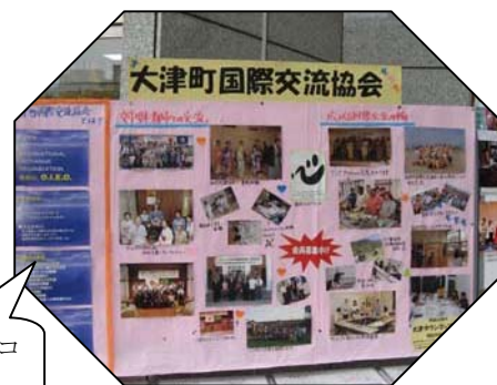
活動紹介のコーナーも