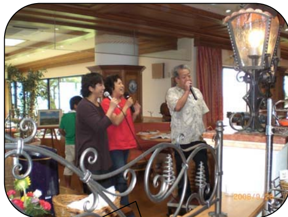
カラオケに思いっきりハッスル