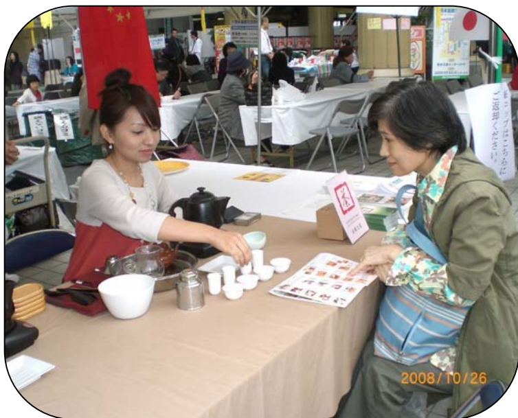
熊本県日中協会が出陣した「中国茶芸の実演・体験コーナー」

今年で十五回目の「熊本国際交流祭典」が十月二十六日（日）、熊本交通センターコートで開催され、多くの県民で賑わいました（熊本県国際協会主催）。国際交流・協力を行っている県内の民間団体などの活動を県民に知ってもらうのが狙いで、三十四団体が参加、各催しを繰り広げました。熊本県日中協会も昨年からの参加、今年はグルメ部門に「中国茶芸の実演・体験コーナー」を設け、入れ立てのジャスミン茶を販売、人気を集めました。