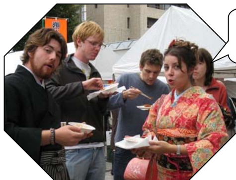
和服がよく似合います